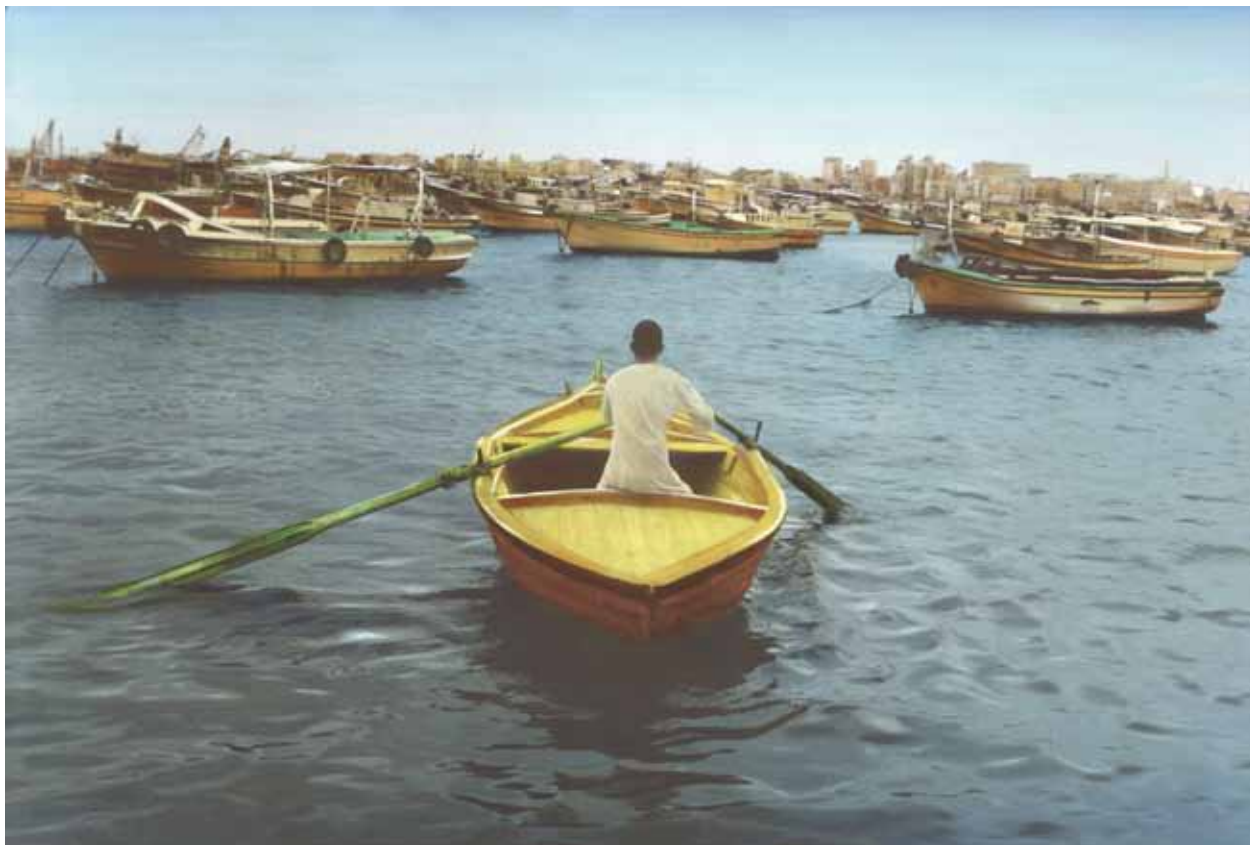
Say Goodbye, Self portrait , Alexandrie, 2009