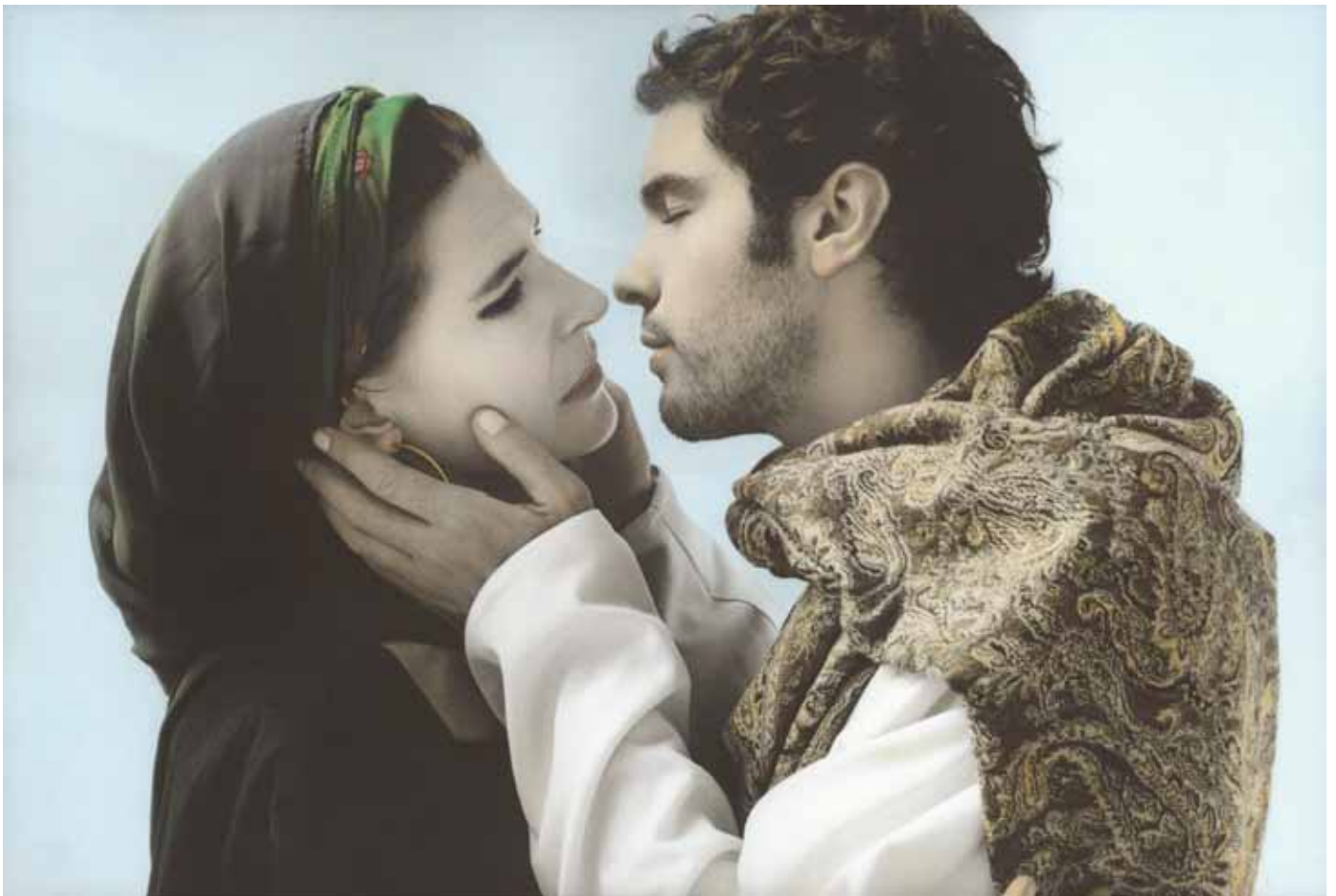
You Never Left#III , 2010 © Youssef Nabil / Courtesy Galerie Nathalie Obadia, Paris/Bruxelles