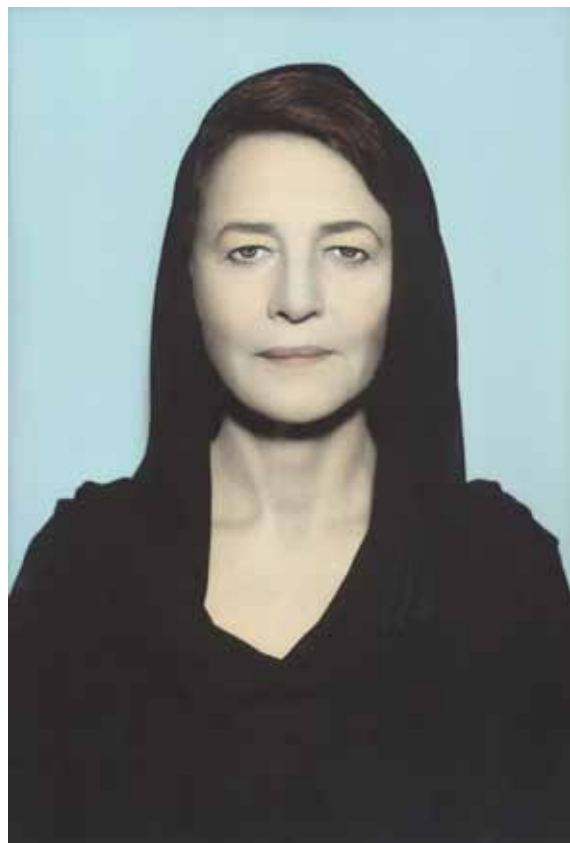
Catherine Deneuve, Paris 2010 / Charlotte Rampling, Paris 2011